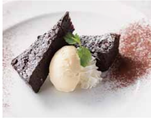
Gateau Chocolat 自家製ガトーショコラ