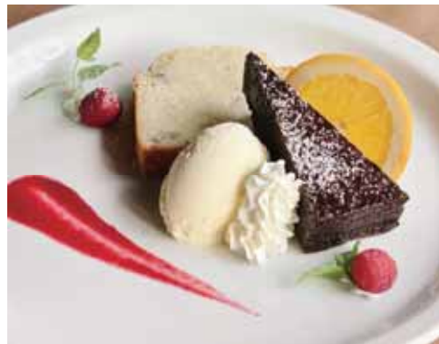
Assorted Dessert Plate デザート盛り合わせ