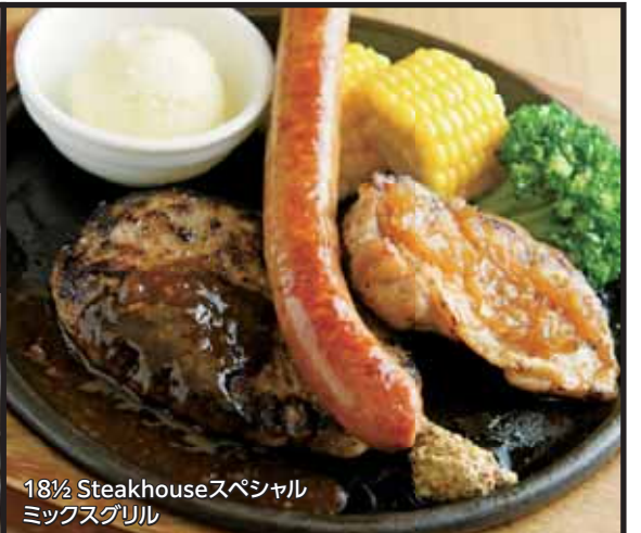
18½ Steakhouseスペシャル ミックスグリル