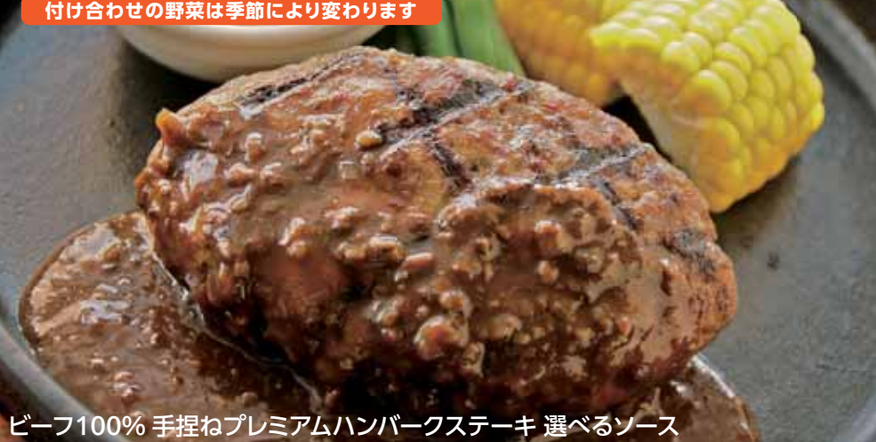
ビーフ100% 手捏ねプレミアムハンバーグステーキ 選べるソース