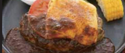
ベジタブル ハンバーグステーキ おろしポン酢ソース