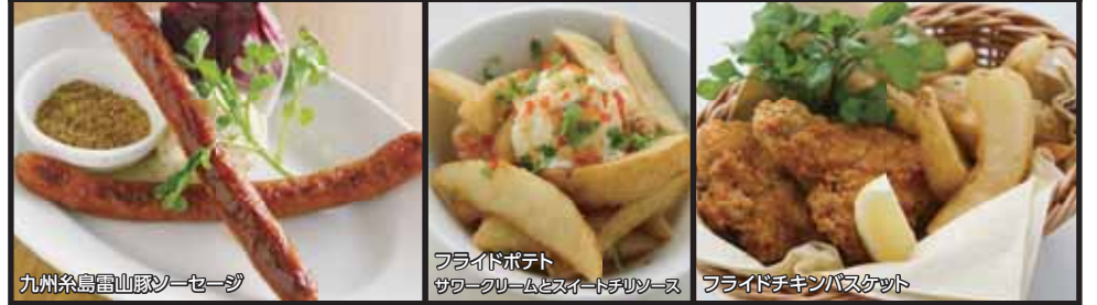
九州糸島雷山豚ソーセージ