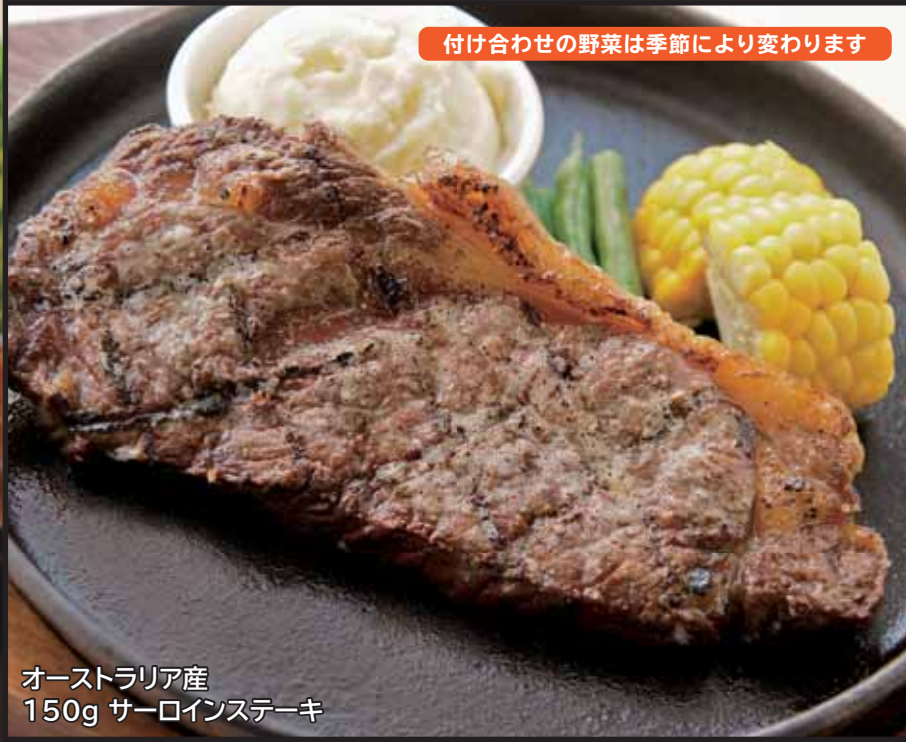
オーストラリア産 150g サーロインステーキ