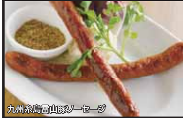
九州糸島雷山豚ソーセージ