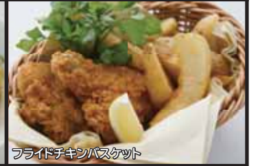
フライドチキンバスケット

フライドポテト ¥560 サワークリームとスイートチリソース Fried Potato with Sour Cream & Sweet Chicli Sauce