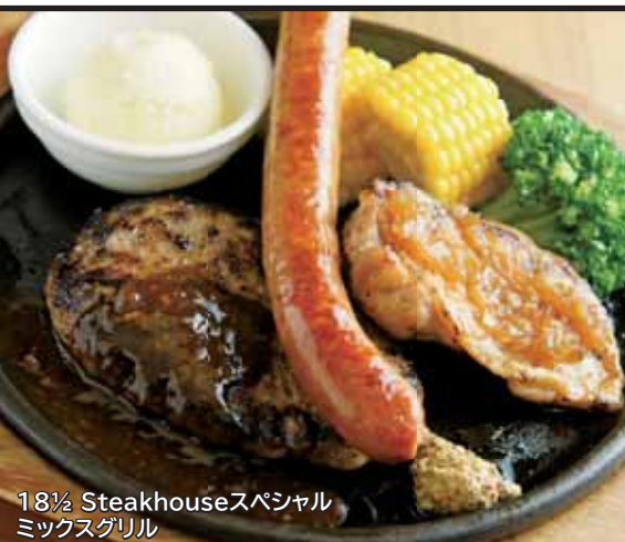
18½ Steakhouseスペシャル ミックスグリル