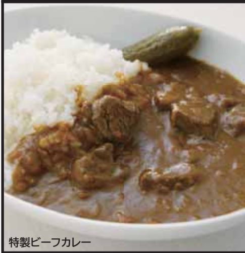
特製ビーフカレー

特製ビーフカレー ¥920 Original Beef Curry & Rice