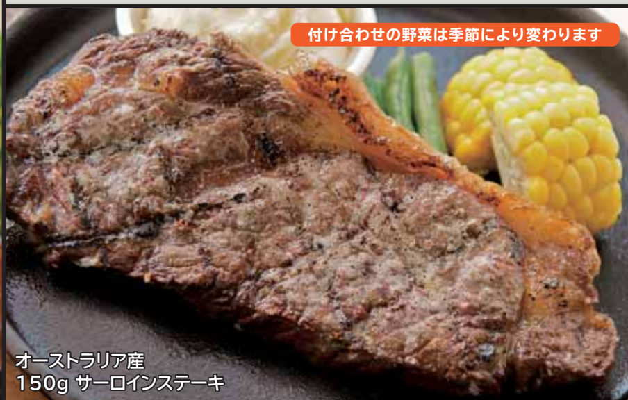
オーストラリア産 150g サーロインステーキ