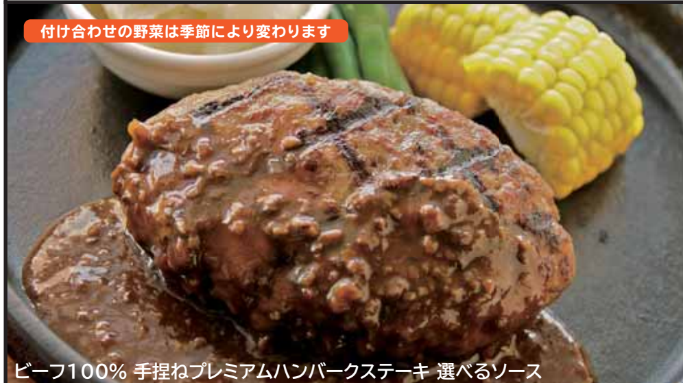
ビーフ100% 手捏ねプレミアムハンバーグステーキ 選べるソース