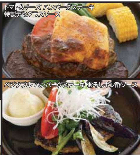
トマト&チーズ ハンバーグステーキ 特製デミグラスソース