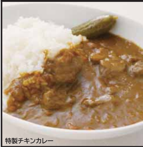
特製チキンカレー

特製チキンカレー ¥920 Original Chicken Curry & Rice