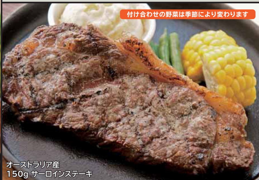
オーストラリア産 150g サーロインステーキ

18½ Steakhouseスペシャル ステーキ ¥2,150 (オーストラリア産 185g リブロース) 【ライス】または【パン】付き