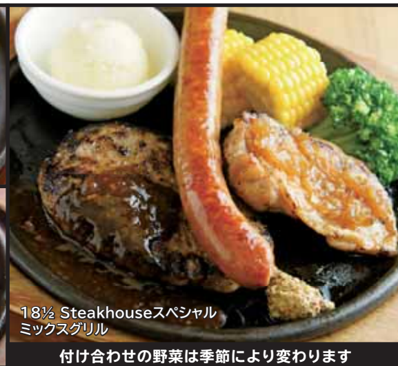
18½ Steakhouseスペシャル ミックスグリル