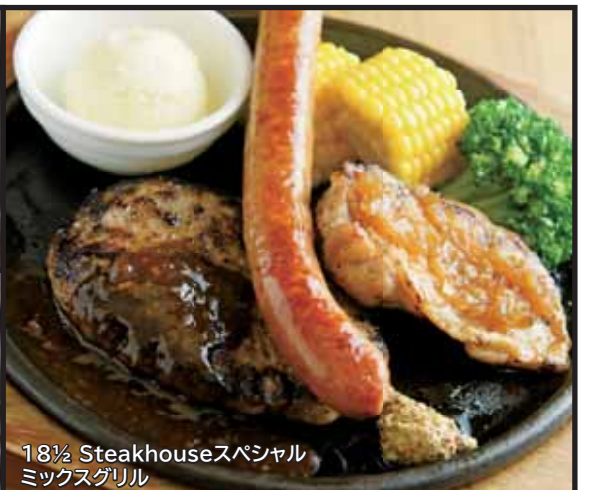
18½ Steakhouseスペシャル ミックスグリル