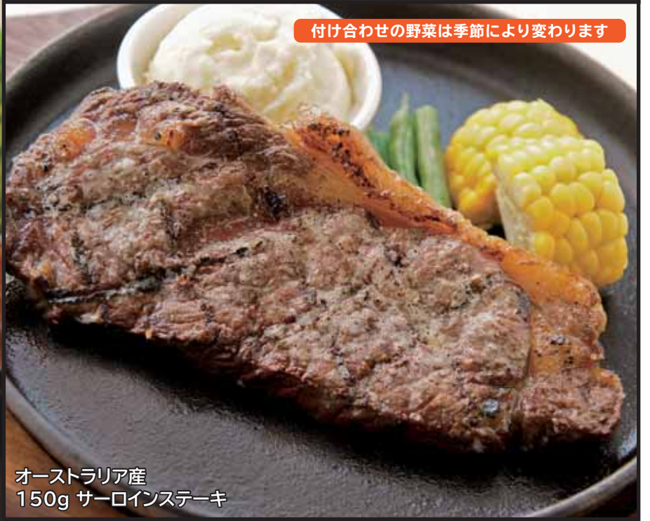
オーストラリア産 150g サーロインステーキ