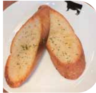
ガーリックトースト Garlic Toast