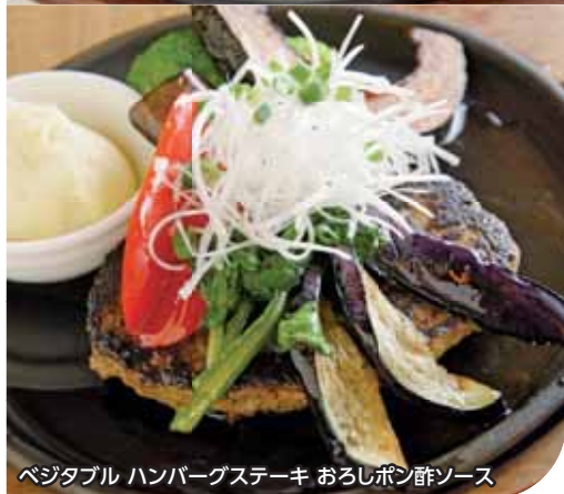
ベジタブル ハンバーグステーキ おろしポン酢ソース