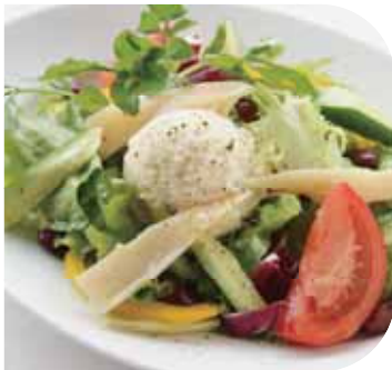
ポテトとホワイトアスパラ、 キドニービーンズのサラダ お好みのドレッシングで

Potato, White Asparagus & Kidney Bean Salad with your choice of dressing