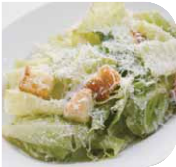
クラシック シーザーサラダ Classic Caesar Salad

Regular Large ¥809 ¥1,364 (¥890) (¥1,500)