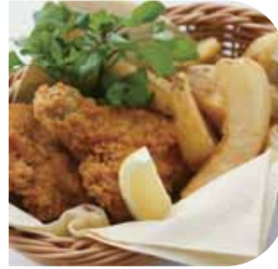
フライドチキンバスケット Chicken Basket