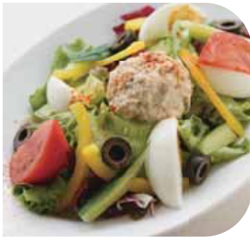
ツナと卵、 ブラックオリーブの ニース風サラダ お好みのドレッシングで

Regular Large ¥809 ¥1,364 (¥890) (¥1,500)