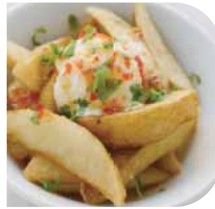
フライドポテト サワークリームと スイートチリソース

Fried Potato with Sour Cream & Sweet Chilli Sauce