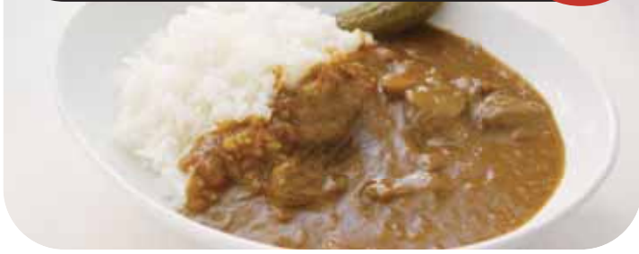
ステーキハウスの特製ビーフカレー Steakhouse Beef Curry & Rice