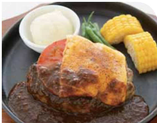
トマト&チーズ ハンバーグステーキ 特製デミグラスソース