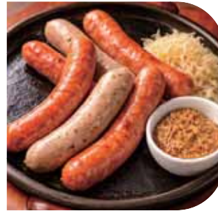
ソーセージ盛り合わせ Assorted Sausage