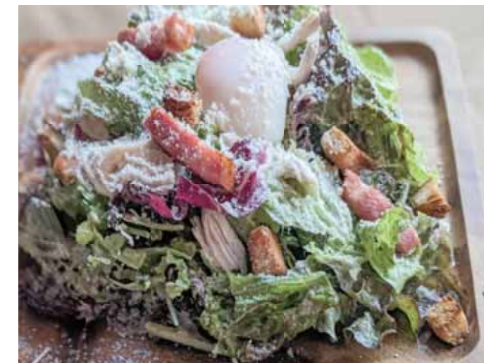
Chicken Caesar Salad