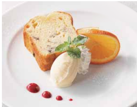
Pound Cake 700 自家製パウンドケーキ (770)