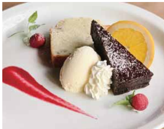
Assorted Dessert Plate 1,000 デザート盛り合わせ (1,100)