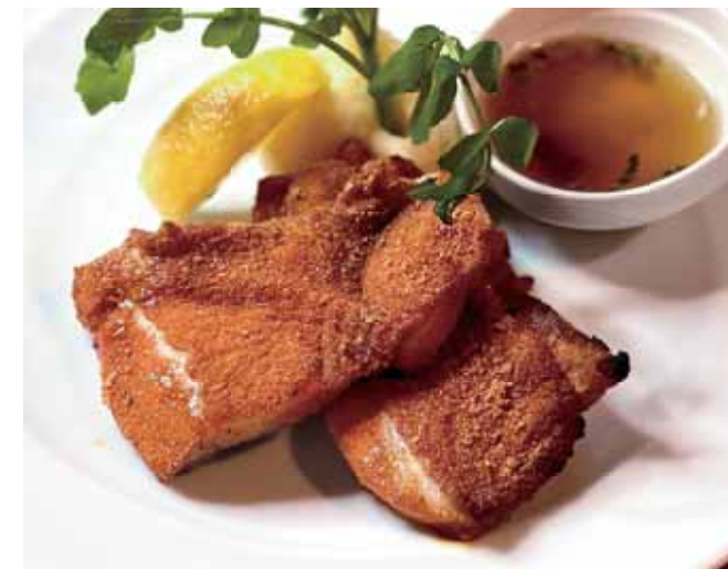
Spicy Garlic Roasted Chicken

Cheddar チェダーチーズ +200 (220) Bacon 国産ベーコン +200 (220) Grated Daikon and Shiso 大根おろしと大葉 +150 (165)