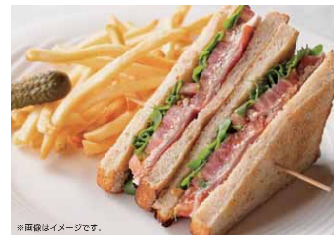
Weekly Sandwich with French Fries