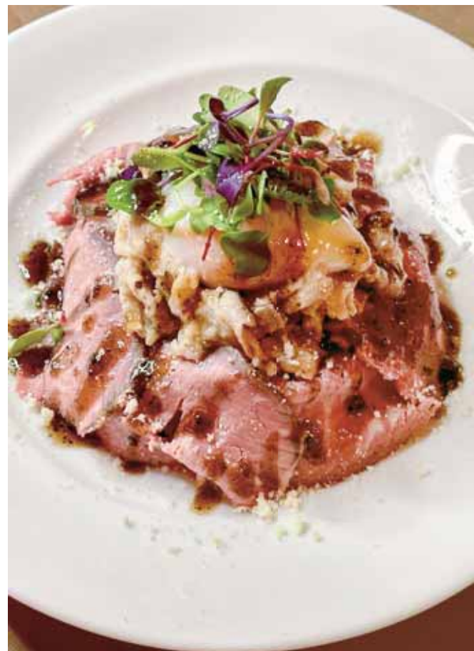
Roast Beef & Pork Rice Bowl, Semi-boiled Egg, Truffle Yuzu Soy Sauce ローストビーフ&ポーク丼 温玉と柚子香る和風トリュフソース

French Fries & Fried Onion Rings +900 フレンチフライとオニオンリング (990)