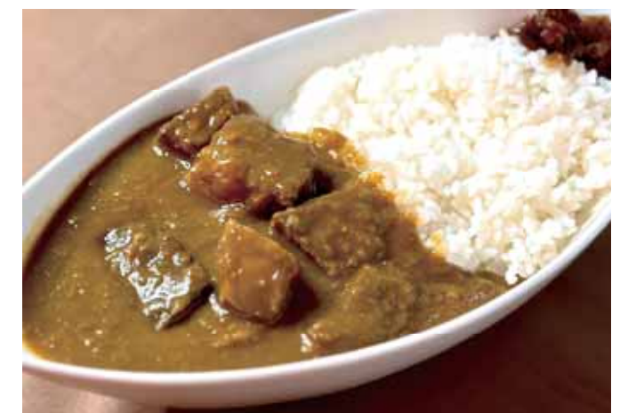
37 Roast Beef Curry Rice Bowl