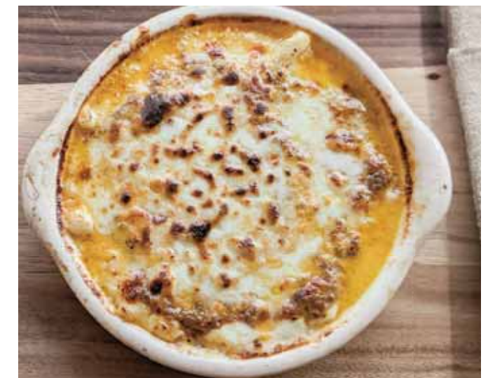
Beef Mac and Cheese