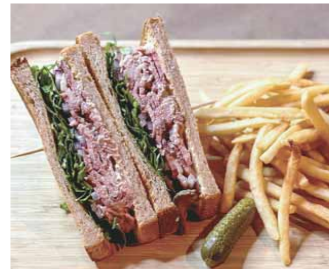
Roast Beef Sandwich with French Fries