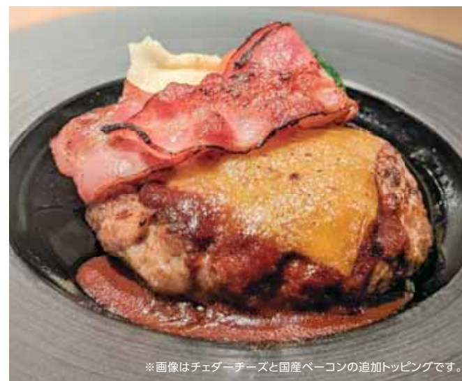
Original Hamburg Steak オリジナルハンバーグステーキ