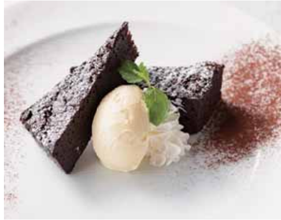
Gateau Chocolat 600 自家製ガトーショコラ (660)