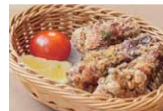
自家製 骨付きから揚げ(3本)