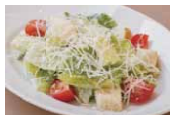
ロメインレタスの シーザーサラダ