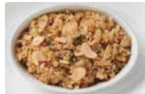
Garlic Rice 1,600 ガーリックライス