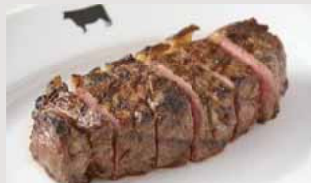
350g Sirloin Steak 13,000 サーロインステーキ 350g