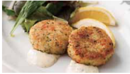
Snow Crab Cake (2 Pieces) 2,900 with Tartar Sauce and Lemon 本ズワイガニのクラブケーキ(2ピース) タルタルソース