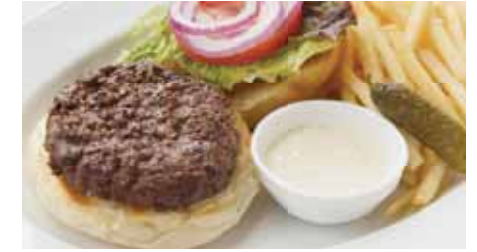
37 Classic Hamburger 180g 37 クラシックバーガー 180g 2,900

Extras チェダーチーズ Cheddar Cheese トッピング ベーコン Grilled Bacon 350 each アボカド Avocado