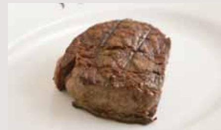
250g Tenderloin Steak 16,000 テンダーロインステーキ 250g

お肉の焼き加減はミディアム仕上げのみとなります。その他の焼き加減はご指定いただけません。 尚、ご注文から焼き上がりまで1時間ほどかかりますのでお時間に余裕をもってご注文下さい。