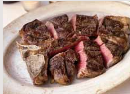
Porterhouse Steak ポーターハウスステーキ(骨付き) 骨を境にサーロインとテンダーロイン(フィレ)の 2種類のお肉が楽しめるステーキ。 2~4名様でお分け頂くのがおすすめです。 800g 29,000 1200g 37,000