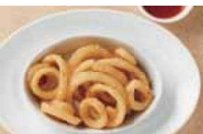
Onion Rings 1,450 オニオンリング