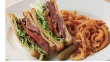
21 Days Aged Black Angus Beef Steak Sandwich, Horseradish Mayonnaise 21日熟成 ブラックアンガスビーフ ステーキサンドイッチ レフォールマヨネーズ 3,700