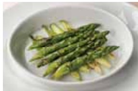
Grilled Asparagus 2,300 アスパラガスのグリル