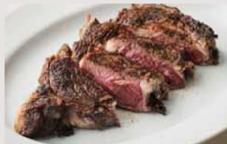
Rib Steak 350g 12,000 リブステーキ 550g 17,000