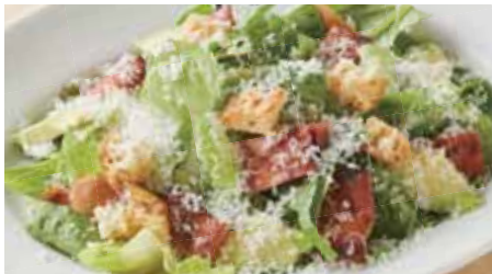
Caesar Salad 2,000 with Bacon and Avocado ベーコン&アボカドのシーザーサラダ クリーミーパルメザンドレッシング