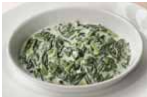
Creamed Spinach 1,500 クリームスピナッチ