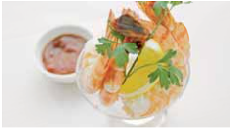
Shrimp Cocktail (6 Pieces) 4,100 シュリンプカクテル(6尾) ワサビカクテルソース