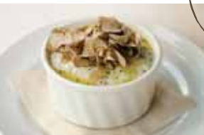
Truffle Mashed 2,900 Potatoes トリュフマッシュポテト