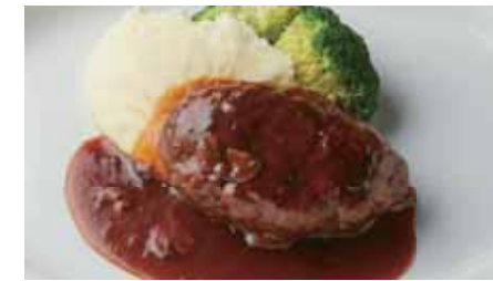
37 Original Hamburg Steak served with Rice 37オリジナルハンバーグステーキ (ライス付き) 2,400

Extras チェダーチーズ Cheddar Cheese トッピング ベーコン Grilled Bacon 350 each アボカド Avocado