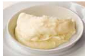
Garlic Mashed 1,400 Potatoes ガーリックマッシュポテト