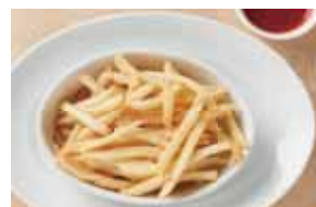
French Fries 1,200 フレンチフライ