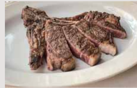
800g Bone-in Sirloin Steak サーロインステーキ(骨付き/800g) 21,000