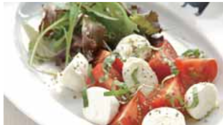
Buffalo Mozzarella 3,600 Caprese Salad 水牛のモッツアレラチーズと フルーツマトのサラダ